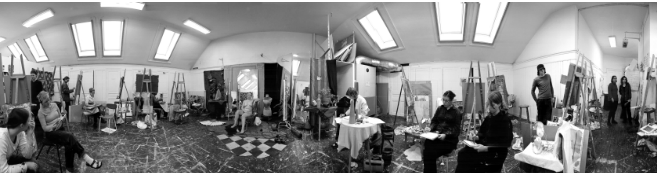
Modellmålning stora ateljén. Foto: Tomas Renström, 2000